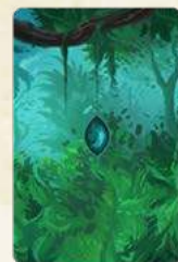
60 карток здібностей