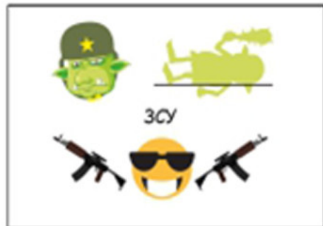
Для варіанту гри 1

На кожній картці зашифровано рядки відомих українських пісень.