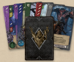
40 поліпшених карт дій