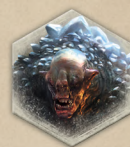
1 жетон троля