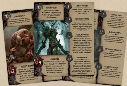
29 великих карт монстрів