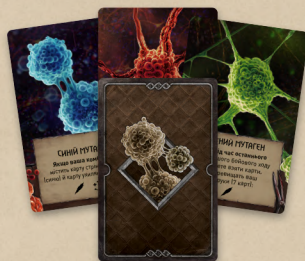
15 карт мутагенів