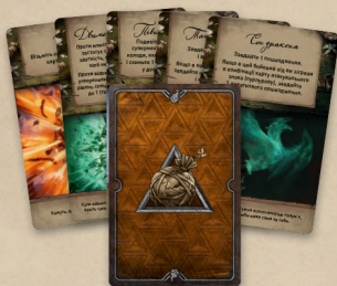
28 карт бомб