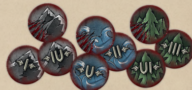
18 жетонів слабкостей монстрів