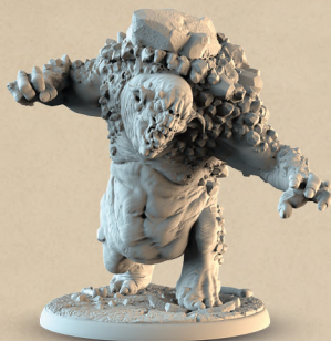
1 фігурка троля