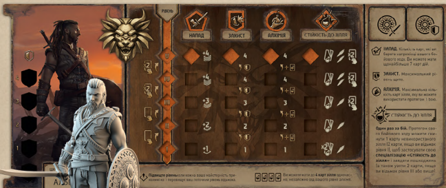
1 планшет гравця