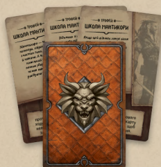
4 карти трофеїв