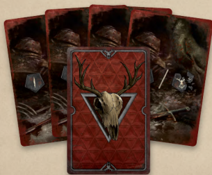
4 особливих бойових карти монстрів