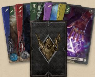
10 початкових карт дій