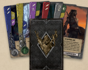
по 1 для кожного відьмака з базової гри, відьмака зі Школи Мантикори й кожного мага з доповнення «Маги»