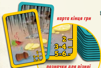
позначки для різної кількості гравців