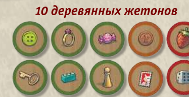
10 деревянных жетонов