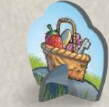
1 фишка с корзинкой