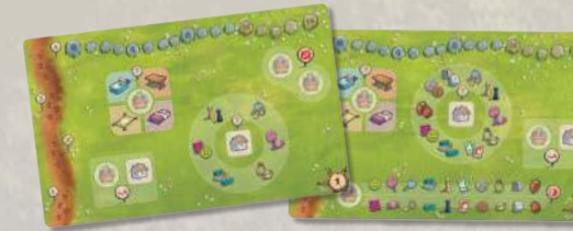
2 двусторонних листа с вопросами (поля 1, 2, 3 и 4)