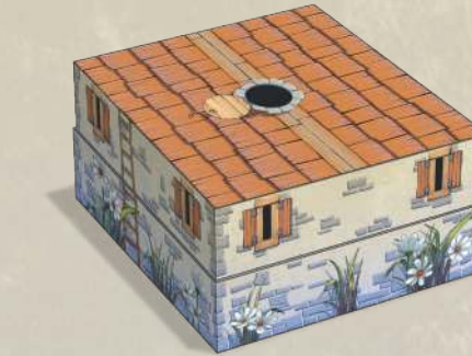
1 коробка с мышиным домом