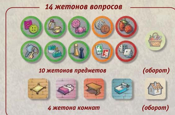
14 жетонов вопросов