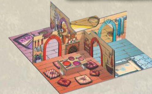
1 поле с комнатами (включая стены и 3D-элементы)