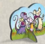
1 фишка с мышами