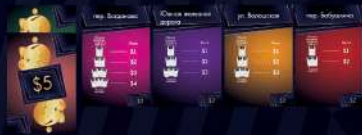
Твоя коллекция Владений