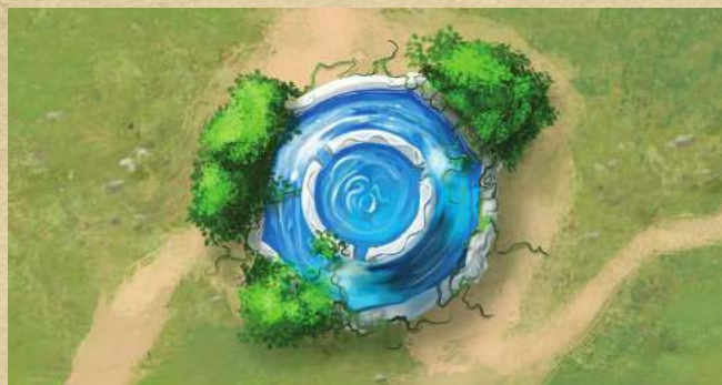
Исцеляющий фонтан - восстановите 2 жизни любому существу.