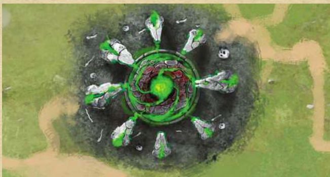
Алтарь проклятий - нанесите 2 урона магией существу противника.