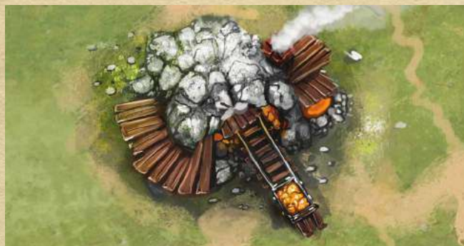
Золотая шахта - получите 2 монеты.