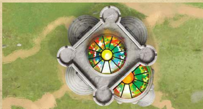
Библиотека - получите 1 ману.