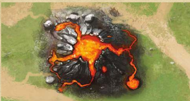
Разлом - 2 урона существу на этой клетке.