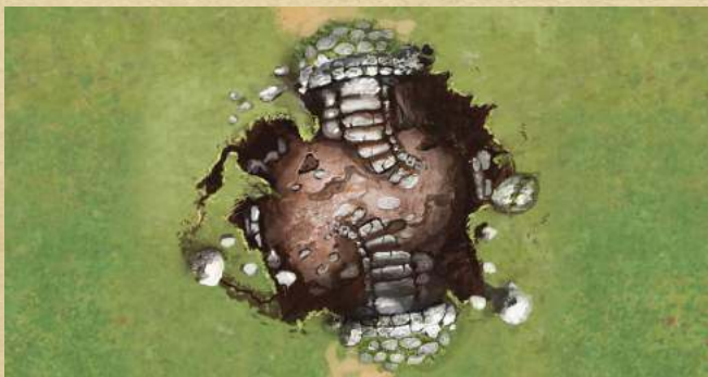
Подземелье - войдите в Подземелье.