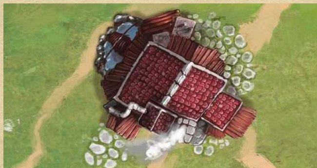
Мастерская - восстановите 2 жизни любому строению.