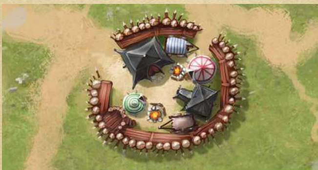
Военный лагерь - добавьте 3 к атаке существу на клетке.