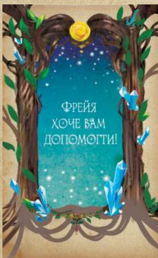
Карта порятунку Фреї

Крім питань, в кожній колоді є чарівні карти, які або допоможуть вам, або загрожуватимуть. Богиня Фрейя - рятує від відповіді. Збережіть її, і використовуйте один раз в будь-який момент протягом гри, щоб уникнути питання, залишившись на тому ж місці. І Хельга, зустрівши яку, потрібно зробити два ходи назад, щоб врятуватися від її магії (але, якщо ви перебуваєте на S, просто залишаєтеся на місці).