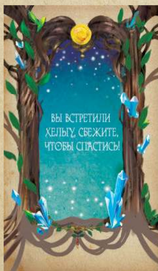
Карта пастки Хельги