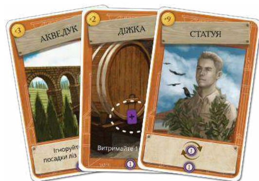
36 КАРТ СПОРУД