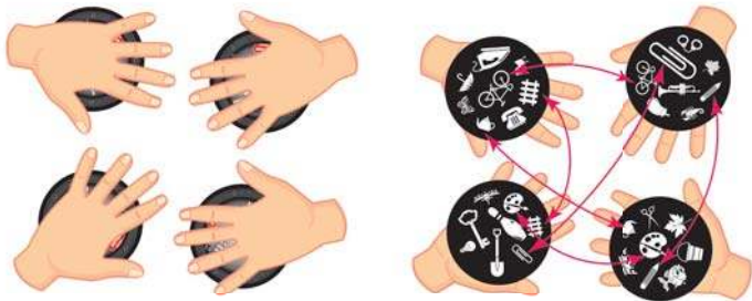
Приклад роздачі карточок на 4-х гравців

Підготовка до гри. Цей варіант гри проходить у декілька раундів. Після перетасовки колоди, гравці отримують по одній карточці. Решта карточок відкладаються в сторону до наступних раундів. Кожен учасник кладе свою карточку собі у долоню (див. мал.).